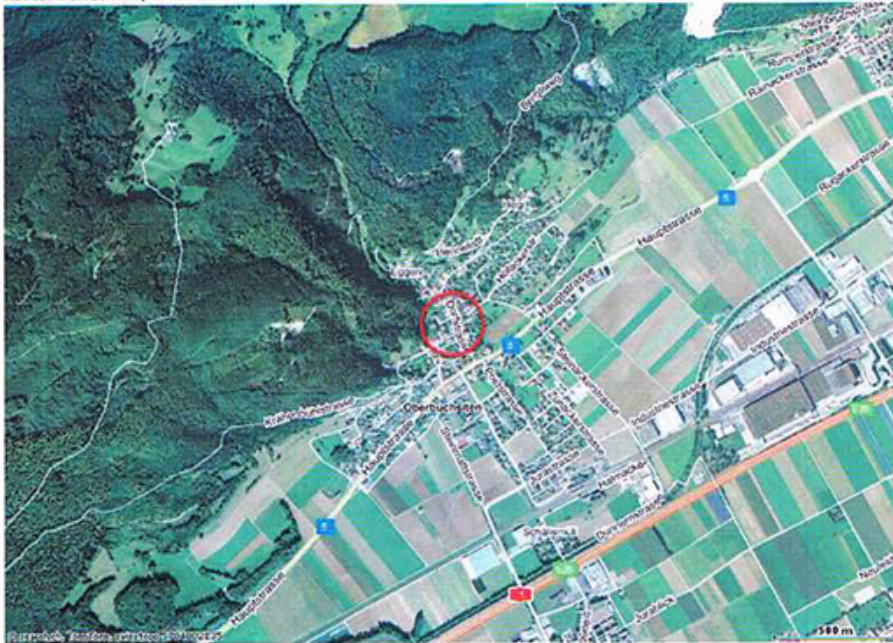
Karte: Dorfstr. 78, Oberbuchsitzen

Anreise/Rückreise mit dem Zug (Fussweg vom Bahnhof ca. 5. Min.)